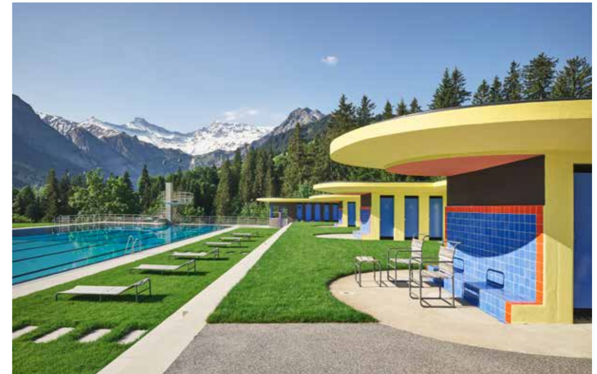
Panorama-Schwimmbad Gruebi, Adelboden, Schweiz